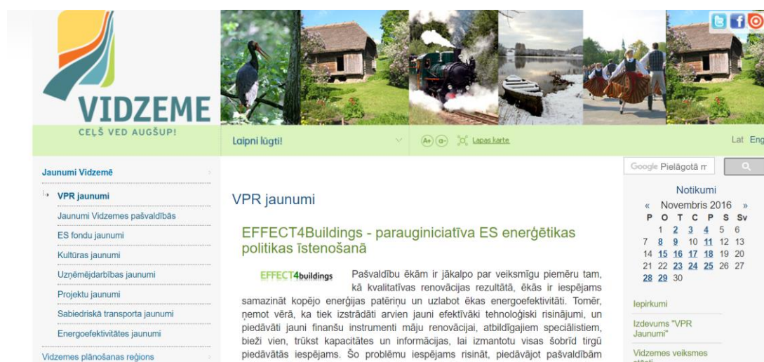
4.attēls VPR mājaslapa www.vidzeme.lv

VPR pārziņā ir portāls www.vidzeme.lv , kas tiek ik dienas papildināts ar informāciju gan par iestādes darbu un paveiktajām aktivitātēm, t.sk., atspoguļojot arī projektu ieviešanu, gan arī sniedzot iespēju VPR pašvaldībām publicēt savas ziņas, lai informācija nonāktu pie pēc iespējas plašākas auditorijas. Veidojot ikdienas komunikāciju, VPR uzsvars tiek likts uz projektu ieviešanas lietderības demonstrēšanu, veidojot priekšstatu par Eiropas Savienības fondu līdzekļu nozīmi attīstības veicināšanā, īpaši akcentējot ieguvumus, ko piesaistītie finanšu līdzekļi ļāvuši sasniegt. Regulāri tiek atspoguļoti arī Attīstības padomes sēžu laikā pārrunātie jautājumi, nodrošinot pilnīgu informāciju par aktualitātēm gan VPR ikdienas darbā, gan arī valstī kopumā.