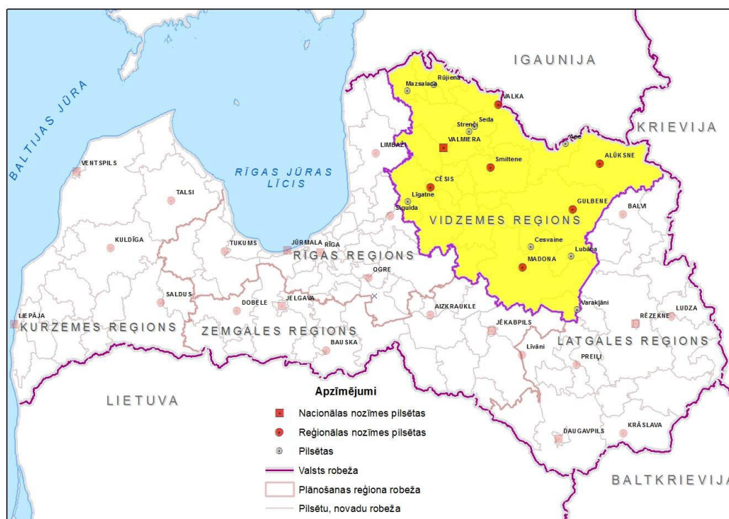
1.attēls. Plānošanas reģionu izvietojums Latvijas teritorijā

Vidzemes plānošanas reģions (turpmāk – VPR) ir viens no 5 (pieciem) plānošanas reģioniem, kas ir teritoriāli lielākais Latvijā, aizņemot 23,6 % no valsts teritorijas. Tā kopējā platība ir 15 245, 43 km 2 .