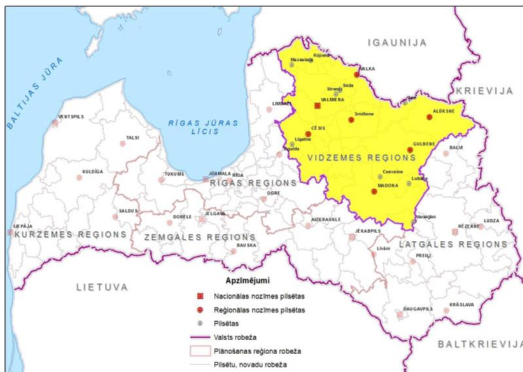
1.attēls. Plānošanas reģionu izvietojums Latvijas teritorijā.

Vidzemes plānošanas reģions (turpmāk – VPR) ir viens no 5 (pieciem) plānošanas reģioniem, kas ir teritoriāli lielākais Latvijā, aizņemot 23,6 % no valsts teritorijas. Tā kopējā platība ir 15 245, 43 km 2 .