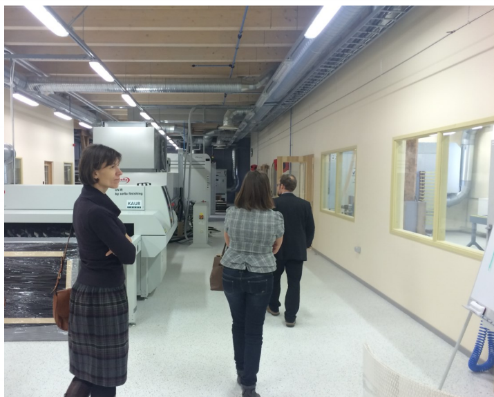
VPR pārstāvji apskata kokapstrādes kompetenču centru TSENER.

reģions ar lielu mežu pārklājums, gan arī ekonomiskās specializācijas jomās – reģionos dominē pārtikas un kokapstrādes produktu ražošana, videi draudzīgs tūrismis, kā arī tiek aktīvi meklēti risinājumi attālinātā darba iespēju attīstība. Kaimiņu reģioni izrādīja lielu interesi sadarboties jaunos projektos, lai kopīgi attīstītu šīs jomas.