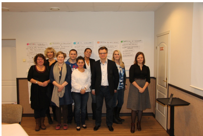
Projekta SEBCO partneri Vidzemē.

VPR pagājušajā gadā kopā ar sadarbības partneriem no Zviedrijas un Polijas sāka īstenot projektu " Sociālie uzņēmumi sadarbībā ar biznesa vidi " (SEBCO). Pētot esošo situāciju, projekts aktualizē sociālās uzņēmējdarbības jautājumus katrā partnervalstī. Projekta noslēgumā tiks izstrādāts vienots projekta pieteikums, lai meklētu risinājumus sociālās uzņēmējdarbības problēmām katrā partnervalstī.