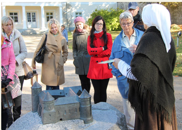
Projekta HANSA partneri viesojas Cēsu pilī.