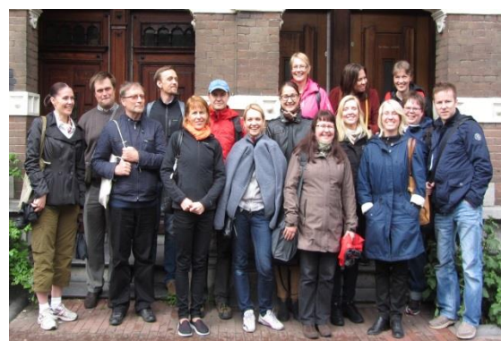
Projekta „BECOSI” pieredzes apmaiņas brauciena dalībnieki.