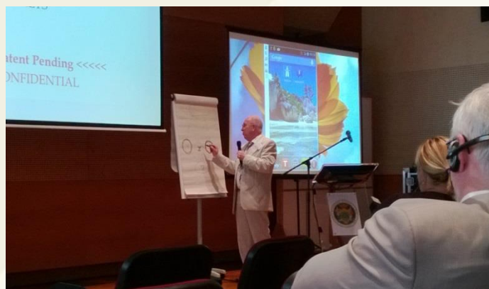
Projekta partneris prezentē inteligēntā transporta risinājumu iespējas