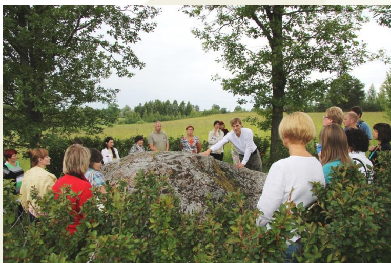
Brauciena dalībnieki pie Daviņu Lielā akmens

Dienu pirms vasaras saulgriežiem tūrisma operatori un mediju pārstāvji no visas Latvijas devās braucienā pa Vidzemi, lai iepazītu skaistākās senās dabas svētvietas, kas apzinātas projektā „Senās kulta vietas – Baltijas jūras piekrastes kopīgā identitāte”. Šoreiz ceļš veda pa interesantākajām vietām maršrutā „Ziemeļvidzemes dabas svētvietu stāsti un nostāsti”, kas izveidots projekta ietvaros. Vairāk par braucienu šeit .