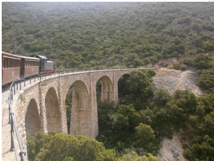
Vilciens Peliona kalnā, Tesalī reģions, Grieķija