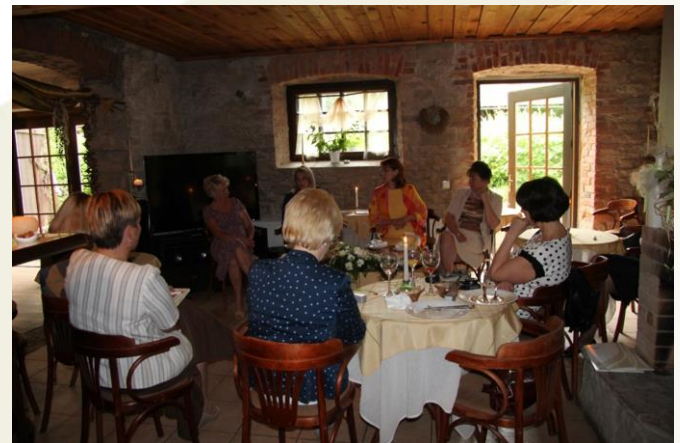
Semināra dalībnieces diskutē par sievietes lomu uzņēmējdarbībā un iespējām veicināt uzņēmējdarbību tieši savā pašvaldībā