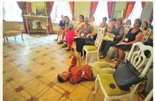
Semināra dalībnieki apgūst Questing mārketinga metodi

Jūnija sākumā Igaunijas-Latvijas-Krievijas Pārrobežu sadarbības programmas projekta „Via Hanseatica” ietvaros Gatčinā (Krievijā) notika tematiskais seminārs „Via Hanseatica produktu attīstība”. Pasākums pulcēja projektā iesaistīto pašvaldību tūrisma uzņēmējus, kā arī tūrisma speciālistus, lai papildinātu savas zināšanas gan par „Via Hanseatica” projektu, gan arī dažādām mārketinga aktivitātēm. Semināra dalībniekiem bija iespēja apgūt arī neierastu mārketinga metodi Questing, ar kuras palīdzību iespējams poētiskā veidā iepazīties ar konkrētās vietas interesantākajiem objektiem.