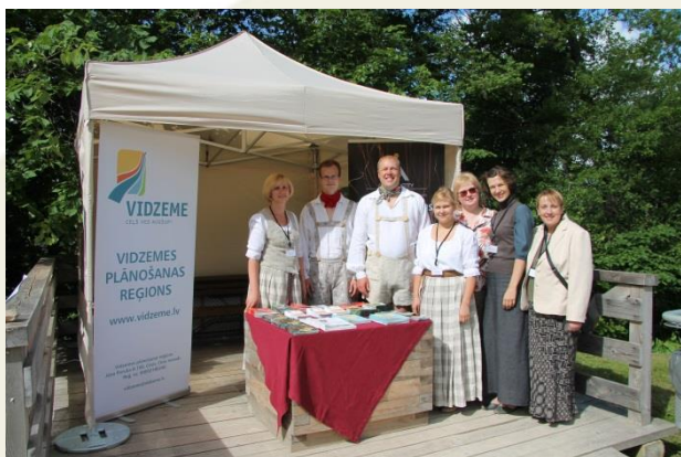
VPR Via Hanseatica komanda brīvdabas izstādē