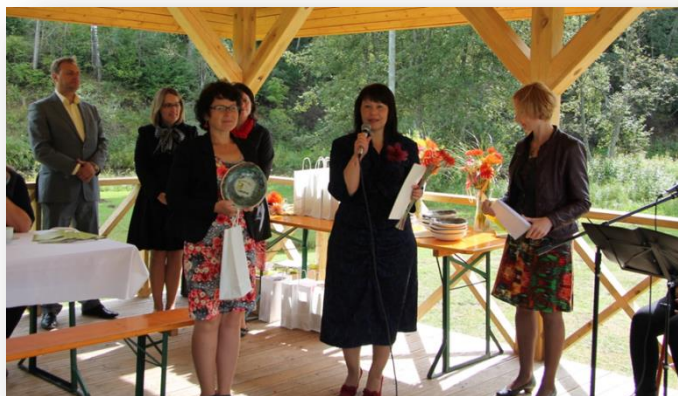
Vidzemes veiksmes stāsti – viens no gaidītākajiem pasākumiem vasarā

Šogad veiksmes stāstu pulkam pievienojušies 26 jauni stāsti, katrs no sava novada. Un tā kā noslēdzas struktūrfondu īstenošanas periods, šajos dārza svētkos uzsvars likts uz iniciatīvām, kas īstenotas ar struktūrfondu atbalstu. Ar visiem šī