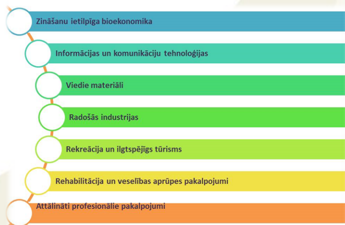
Attēlā: Apzinātas jomas, kurās Vidzemes plānošanas reģionam ir potenciāls

Par apzinātajām jomām variet iepazīties šeit . Pilns pētījuma saturs pieejams šeit .