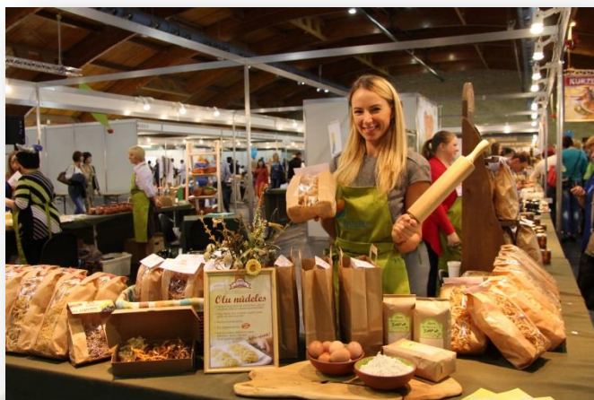
SIA EkoMako nūdeles Vidzemes stendā izstādē Rīga Food 2014

stendū piedalās arī mūsu mājažotāji. Šogad stendā pavisam kopā bija 30 dalībnieki, piedāvājot stenda viesiem tādas labumus kā mājas sieri, tortes, maizes izstrādājumi, garšvielas, tējas, mājas vīni, sulas, aitas gaļa, melnie ķiploki un daudz ko citu.