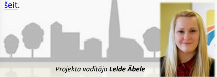
Projekta vadītāja Lelde Ābele